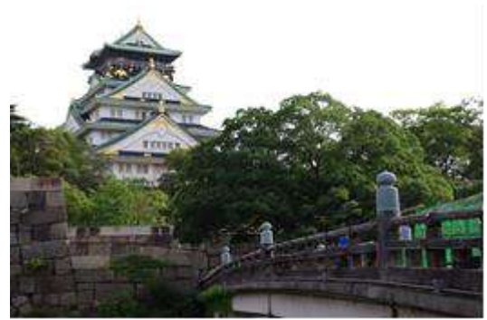
Castillo de Osaka