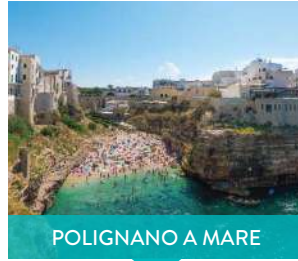
POLIGNANO A MARE