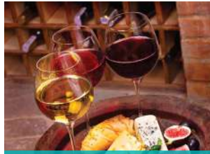
MANDURIA (Museo del vino)