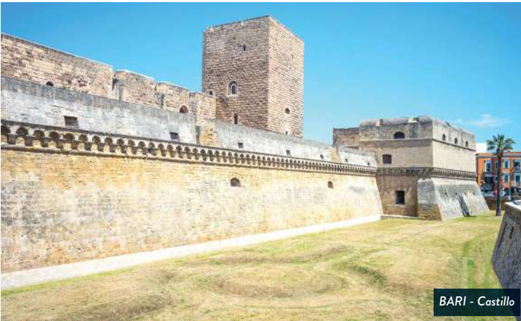
BARI - Castillo

Llegada a su hotel en Bari donde el guía le esperará. Haga el check-in, de acuerdo con su hora de llegada y por la tarde (alrededor de las 14:00 h) comience a descubrir Apulia con un fascinante paseo por el casco antiguo de la ciudad que incluye la Basílica de San Nicolás y la hermosa Catedral de San Sabino, que son uno de los más grandes ejemplos de la arquitectura románica de Apulia. También podrá visitar el famoso Castillo Normano-Suabo (exterior) - Fortaleza del siglo XII, que fue construido por Roger el Normando y después de su destrucción parcial fue reconstruido por Federico II de Suabia. Este castillo