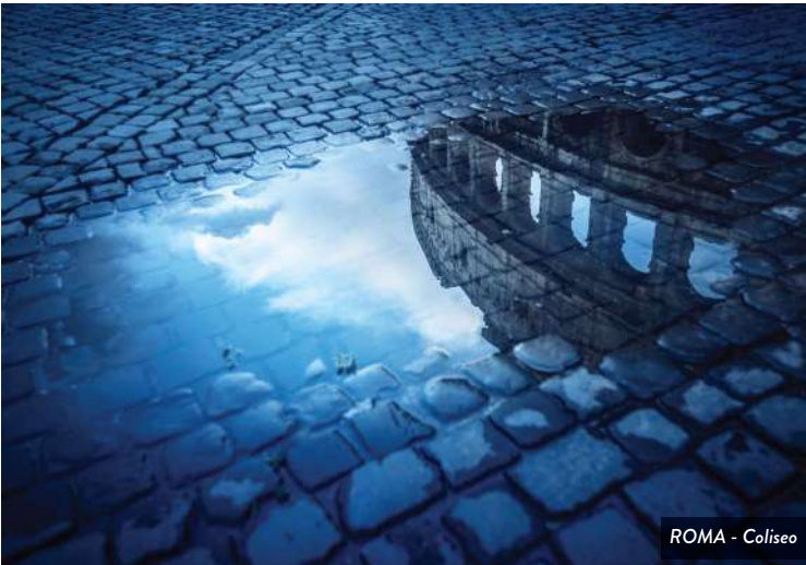
ROMA - Coliseo