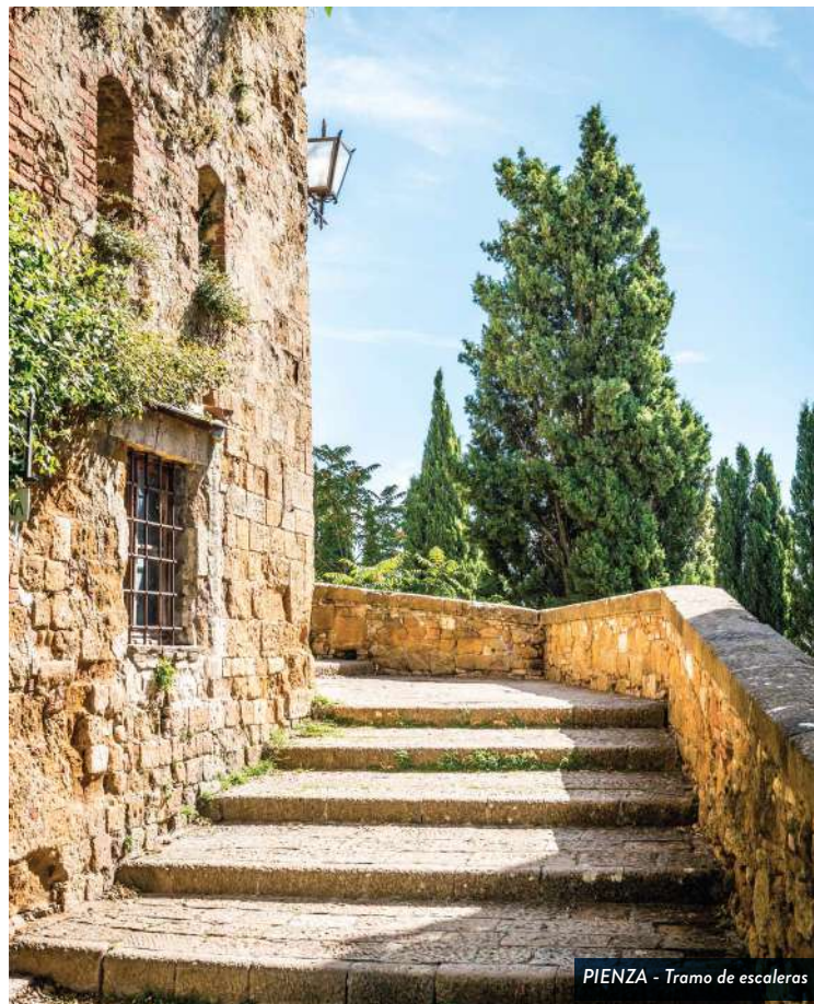
PIENZA - Tramo de escaleras