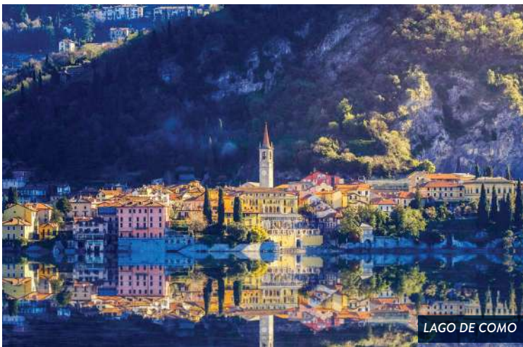
LAGO DE COMO

VENECIA - SIRMIONE (LAGO DE GARDA) - LAGO COMO - MILÁN (1 noche) - LA SPEZIA - PORTOVENERE (GOLFO DEI POETI) CINQUE TERRE - LUCCA (1 noche) - PISA -