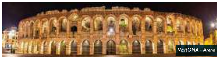
VERONA - Arena

De camino a Venecia, embarcamos en Sirmione para recorrer las aguas del Lago de Garda donde se conocerán puntos de interés como la Villa de Maria Callas y las Cuevas de