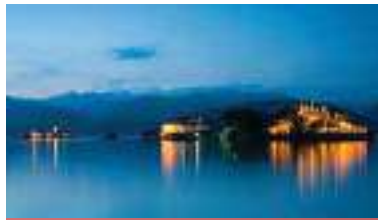
REGIONE DE LAGOS