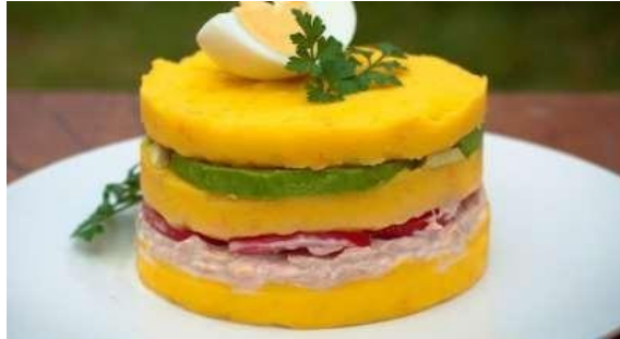
CAUSA A LA LIMEÑA