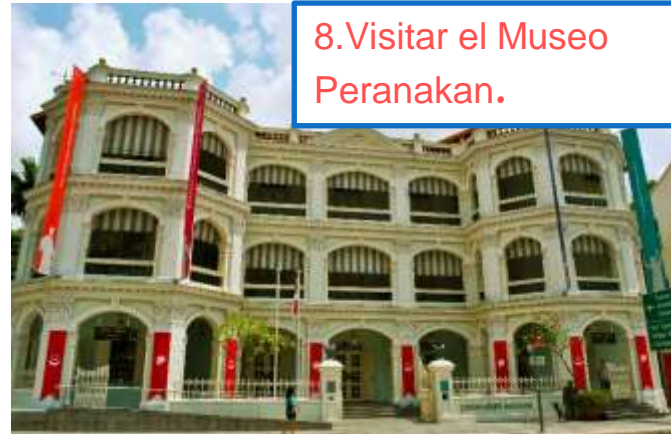
8. Visitar el Museo Peranakan.

En el sector de Imbiah Lookout se encuentra la torre Tiger Sky que es la más alta del país, con sus 36 pisos y 110 metros de altura, se logra una hermosa vista de la ciudad estado de Singapur.