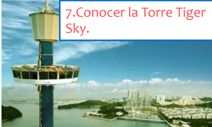
7. Conocer la Torre Tiger Sky.

En el sector de Imbiah Lookout se encuentra la torre Tiger Sky que es la más alta del país, con sus 36 pisos y 110 metros de altura, se logra una hermosa vista de la ciudad estado de Singapur.