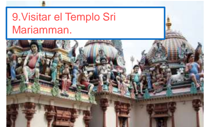
9. Visitar el Templo Sri Mariamman.

Si quieres conocer más de la cultura Peranakan este museo debes visitar. Para entender la cultura de Singapur es importante conocer su herencia.